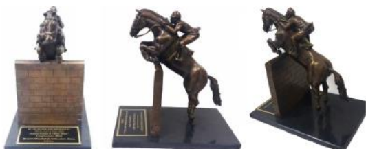
Troféu Perpétuo NELSON PESSOA, escultura em bronze obra do artista Marco André de Salles, celebrando o Record Mundial de Salto sobre Muro à 2,33m, em Longchamps, 1983, com a égua MISS MÖET

Juniors, Young Riders, Seniors Competição em 2 Voltas - Tab.A 273.2.2/273.3.3.1 e 273.4.3; passagem Decisiva Velocidade, 375m/min Altura dos obstáculos: 1,40m a 1,45m Nº cavalos/ cavaleiro: 1 Premiação Total em espécie: R$ 80.000,00 ( distribuição conforme Tabela)